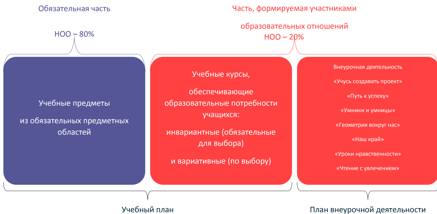
Схема 1. Части основной образовательной программы

Обязательная часть представляет собой совокупность учебных предметов из обязательных предметных областей. Формируемая часть представляет собой инвариантные (обязательные для выбора) и вариативные (по выбору) курсы учебного плана и курсы внеурочной деятельности (схема 1).