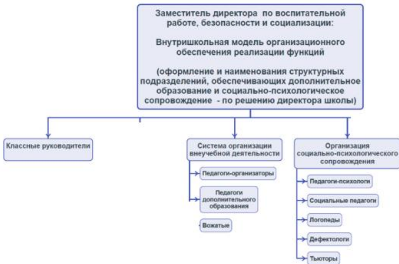
Схема 2. Кадровое обеспечение реализации программы воспитания